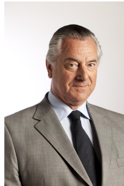
Dr. Ignacio de Posadas Montero

When such convictions are embedded in its social fabric, small nations are able to stand tall, are able to broaden their presence on the world stage, and are able to secure the respect of the international community. The direct outcome of all of this was the strengthening of a cultural identity imbued with a respect for the rule of law and for the sanctity of contracts. This definitely consolidated intangible asset that feeds its social culture, strengthening a nation that understands and decides what type of future it wants.